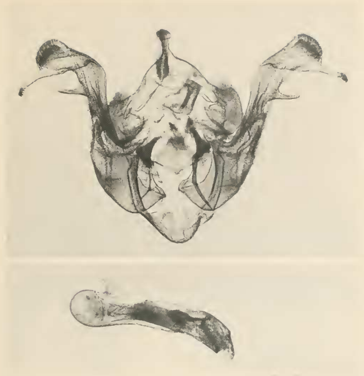
Abb. 3: ♂ Genitalapparat von Oligia dubia Heydem.

(Heydemann 1964). Nach weiteren 11 Jahren wurde die Art 1970 wieder in Österreich aufgefunden. Habeler konnte den Nachweis aus mehreren Orten des Bundeslandes Steiermark erbringen (Habeler 1972). Nun konnte die Art neuerdings auch in Italien aufgefunden werden.